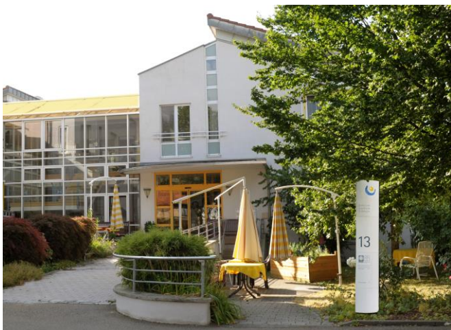
Ein Blick auf unseren demenzfreundlichen Garten